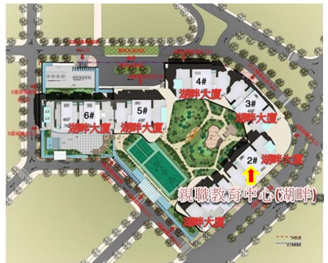
親職教育中心(湖畔)位置