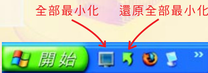
圖七：上圖兩個圖標是另外自行設定的