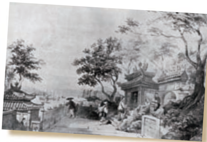
法國畫家博爾傑（Aguste Borget）在19世紀繪畫的作品