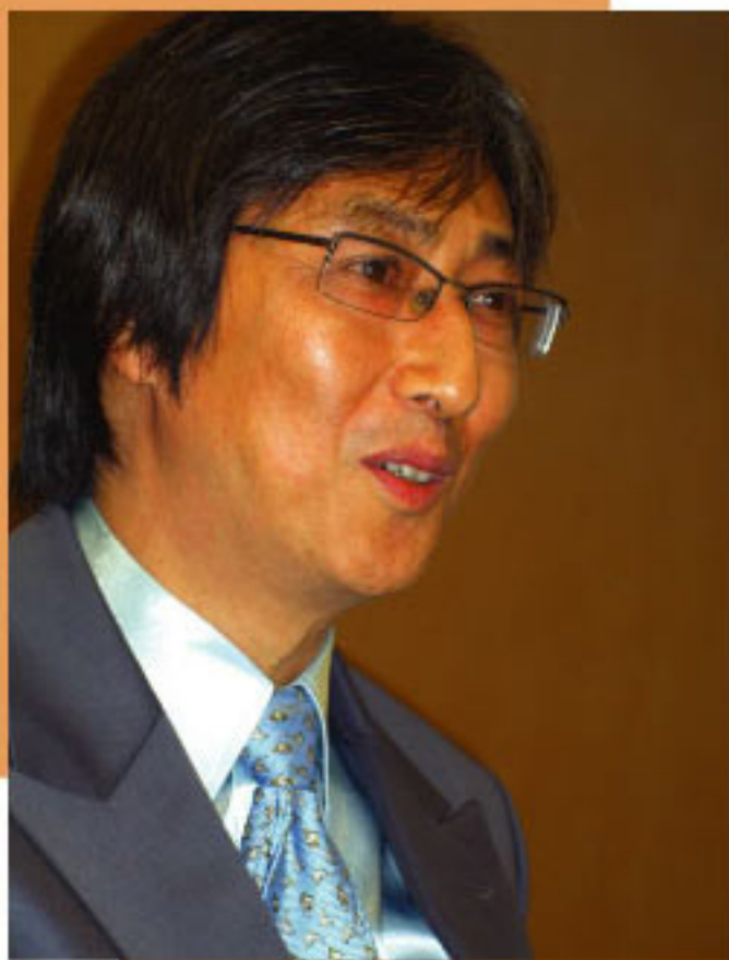
陳先生強調身教的重要

“以前，曾以打罵的方式教育小朋友，但事倍功半，更將小事化大，令大家情緒越來越失控，很影響彼此的感情。”