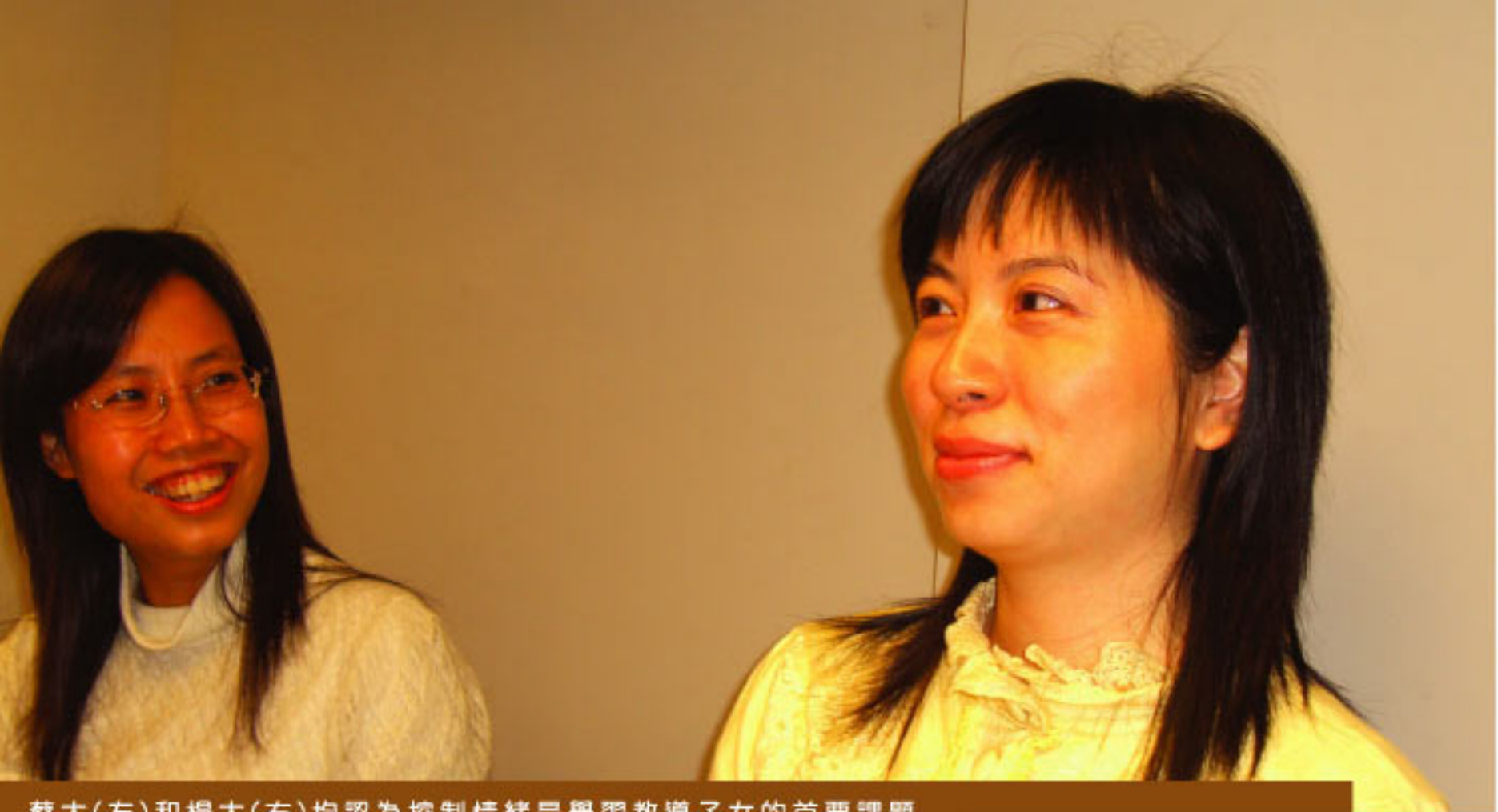
蔡太(左)和楊太(右)均認為控制情緒是學習教導子女的首要課題

“小朋友才這麼年幼，可以做出甚麼壞事？大不了又是些淘氣事，小的時候我們誰沒有？犯不着對小朋友動粗，這是幼兒成長的必經階段。”楊太說。