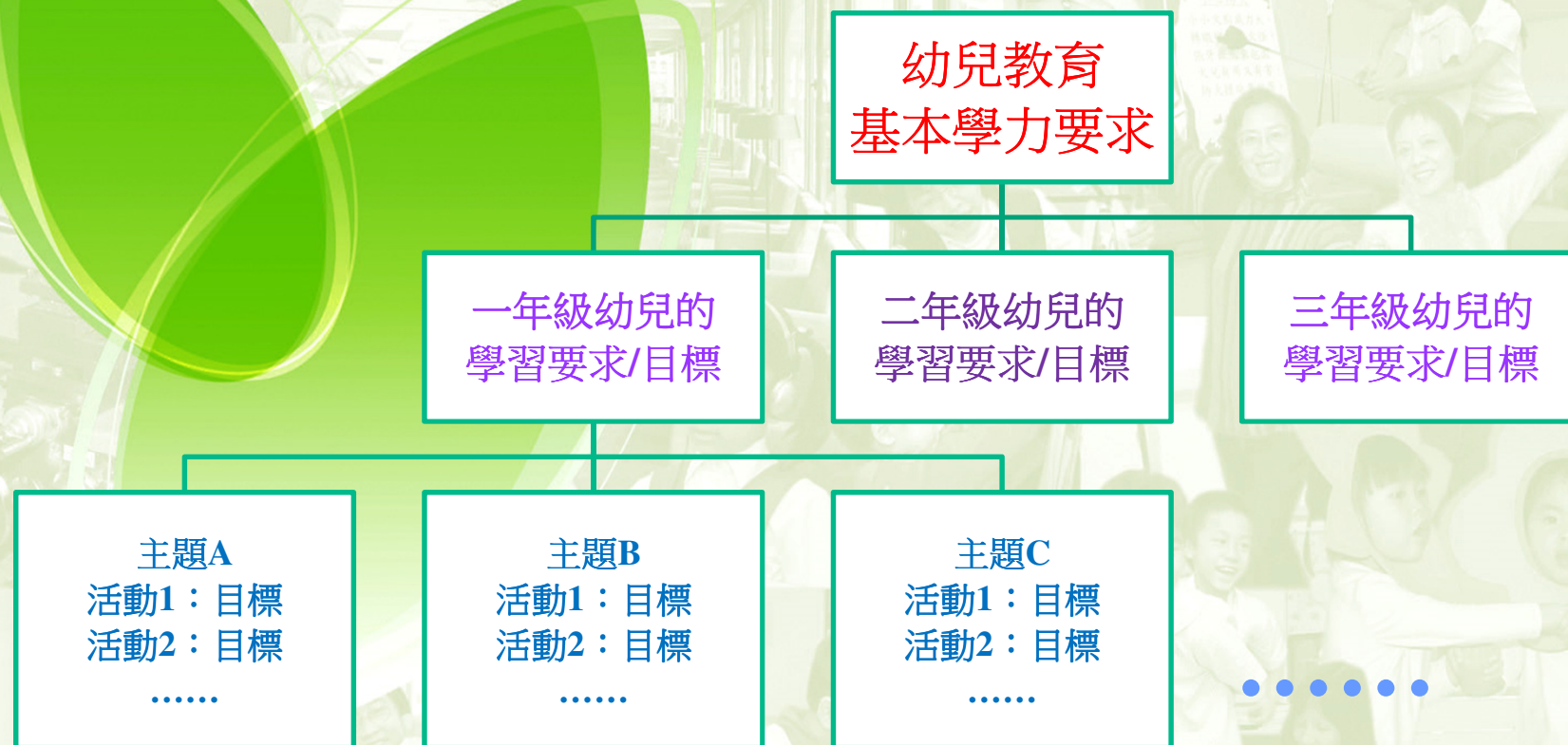
圖：基本學力要求落實至幼兒各年級、各主題、各活動的分解說明