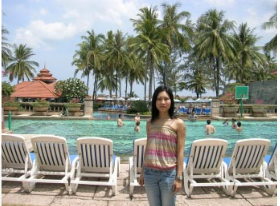
作者於泰國布吉島渡假

如果你想遠離繁囂、靜靜地享受陽光與海灘，布吉實在是一個很好的選擇。與曼谷相比，布吉比較舒服、寧靜，沒有半點緊張和繁盛的感覺。我選擇住在離機場不遠的 "Laguna Beach Resort" 酒店，這間酒店和其他四間酒店是環湖而建，五間酒店各具特色。當我一步入酒店，立刻可以感受到酒店裡到處散發著的濃郁的熱帶風情，熱情的接待員立即送上一個小花環和一杯透心涼的泰國飲品，幫你身體即時降溫，簡直是 "五星級" 的服務。